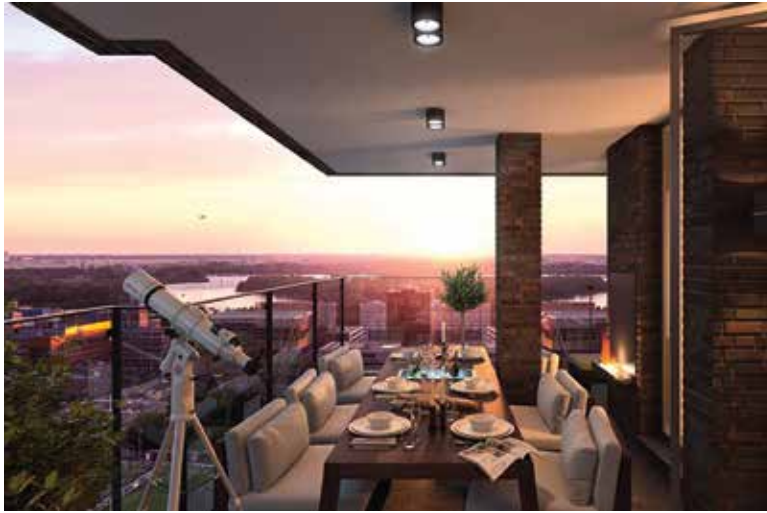
Uitzicht vanuit woontoren 900 Mahler

Voor dit type is de huur onder de 1000 euro en de koopprijs onverwacht redelijk. Binnenkort worden ook 58 sociale huurwoningen opgeleverd. De mix van woningtypen maakt het mogelijk dat er een diversiteit aan bewoners ontstaat, die nodig is voor een echt Amsterdamse wijk. Veel