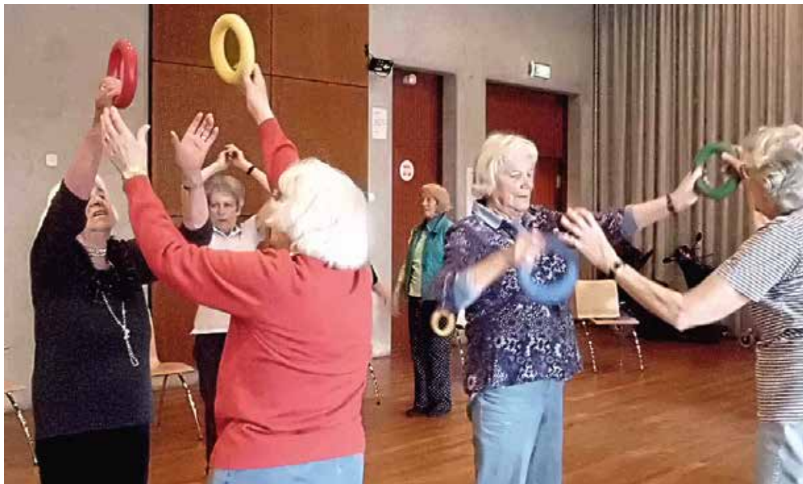
Ouderingym in Het Huis van de Wijk Buitenveldert

Voorwaarden hiervoor zijn passende informatievoorziening, veilige en schone straten, een gevarieerd winkelaanbod en aandacht voor ICT vaardigheden bij ouderen. Ook levendigheid in de wijk is een belangrijk aandachtspunt voor oudere bewoners. Ten slotte vragen ouderen aandacht voor sociale cohesie.