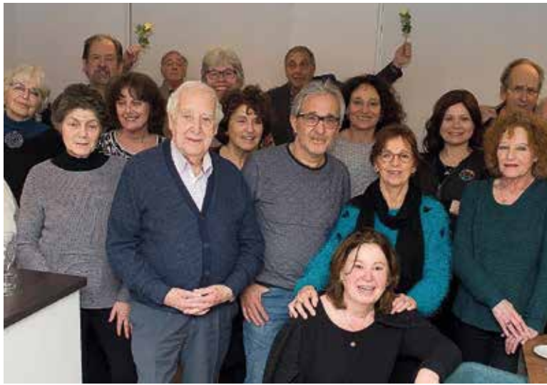
Dit jaar gaat Lev activiteiten aanbieden die voor alle ouderen in de wijk interessant kunnen zijn.

Het Joods maatschappelijk werk, waar Lev een deel van is, concentreert zich voor een groot deel in Buitenveldert. De wijk wordt als relatief veilig en rustig ervaren. Hier bevinden zich de Joodse scholen, winkels en horeca. De Jumbo heeft een koosjere afdeling. Dat trekt mensen en zorgt voor een markt. Lev richt zich specifiek op Joodse ouderen die zelfstandig wonen en gaat daarbij uit van de kracht van de mensen zelf. Het Joods maatschappelijk werk is ontstaan door de