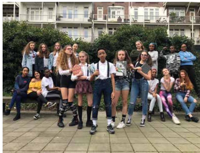
Leerlingen van het Zuiderlicht College treden voor u op.

Dinsdag 24 april om 15.00 uur trakteert het Huis van de Wijk u op een middag vol dans en gezelligheid.