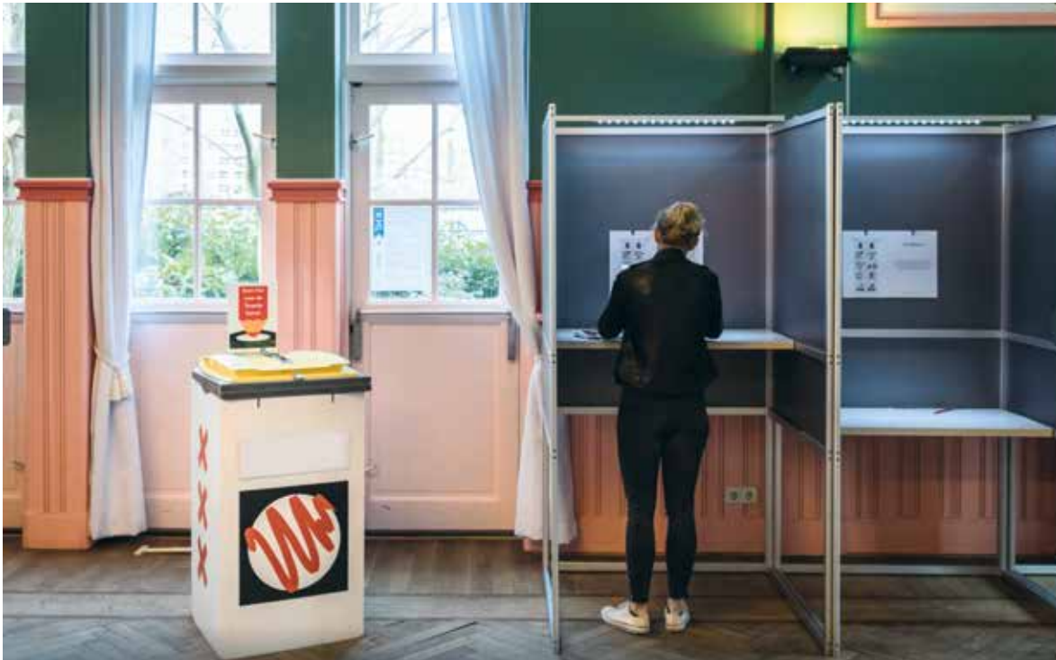
Verkiezingen in Amsterdam.

Als we uitgaan van de verkiezingsprogramma's dan blijken er flinke verschillen. Groen Links wil betaalbare woningen voor iedereen, de SP plus PvdA 40% voor sociale woningbouw, 40% voor het middensegment en 20% duur. D66 wil vooral bouwen voor het middensegment. Groen Links een duurzame economie, terwijl de anderen meer werk willen voor mensen die moeilijk aan de slag komen. Duurzaamheid is trouwens een lastig onderwerp, want daarover is het verschil tussen de droom en de daad groot. Het idee 'Gas de Wijk uit' voor bestaande appartementen zit nergens in de uitvoering. Een mooi warmteproject in Oost bijvoorbeeld wordt geblokkeerd door een spoorbaan. Natuurlijk gaan we Amsterdam en Nederland redden, maar vandaag niet. De SP wil als enige de marktwerking uit de Zorg halen, Groen Links wil meer preventie, de PvdA eenzaamheid bestrijden en D66 voor Zorg & Welzijn meer zorg en minder regels. Ook de plannen voor