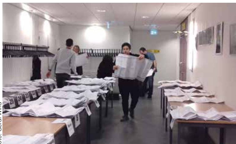
Stemmen tellen in Buitenveldert.

De campagne voor de verkiezing voor de gemeenteraad leek overspoeld te worden door het retorisch geweld van de landelijke partijleiders. Gelukkig was er genoeg reuring in de stad rond de gemeenteraadsverkiezing. Maar veel kiezers in Buitenveldert/Zuidas